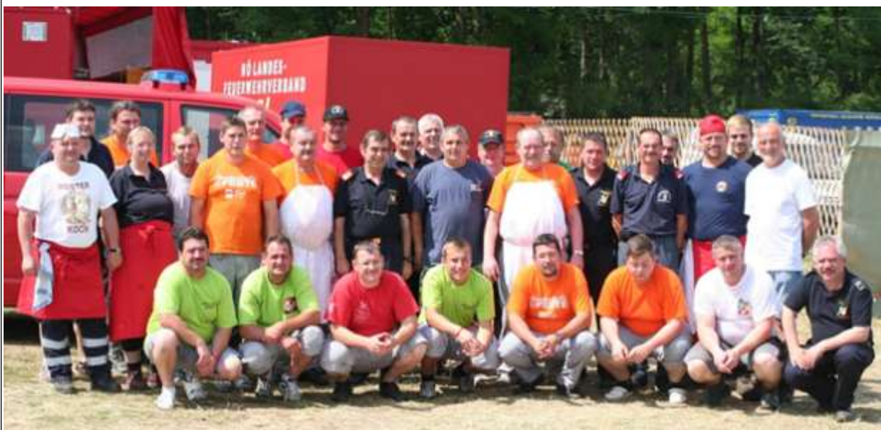
Das Team des Versorgungsdienstes

Jugendbetreuer: Fragt unbedingt bei Euren Kids nach ALLERGIEN bzw. UNVERTRÄGLICHKEITEN!!! Bei solchen bitte an die Versorgung wenden!