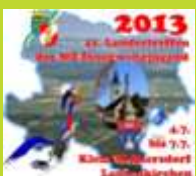
Heiss: Sonnenschein und Bewerbe